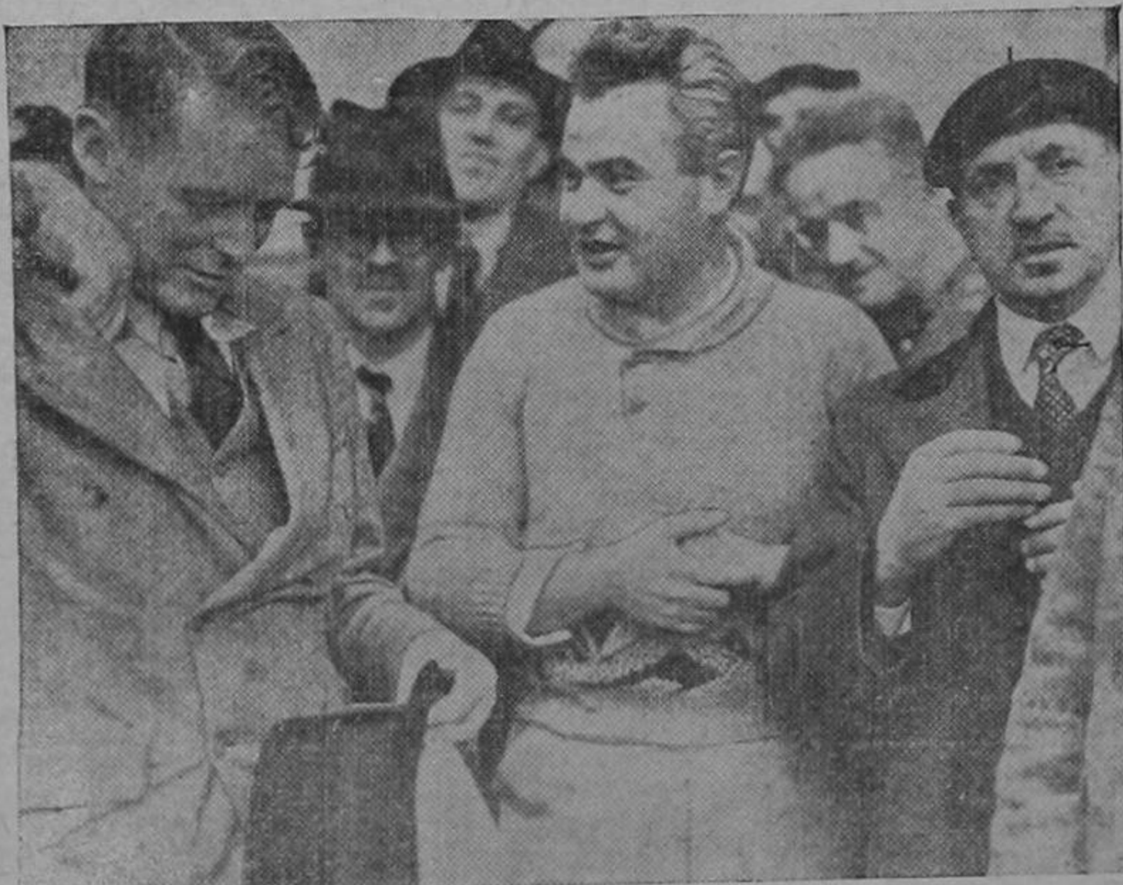
El general austriaco-canadiense Kleber (centro), que en un tiempo encabezó un ejército comunista contra Chiang Kai-Shek en la China y que ahora es co-

nuación procedieron las antes mencionadas personas a visitar esos lugares. De todos ellos, el que a juicio de los presentes pareció reunir mejores condiciones fué el que el municipio ofreció ceder y que corresponde a las pedregas de materiales. Es una propiedad circundada de altas lapias de ladrillo y cemento que tiene una área no inferior a los 4 mil metros cuadrados, situada a 200 metros al sur del parque central de la vieja Montepoli. Por sus condiciones especiales fué la designada para situar allí el molino que será trasladado inmediatamente de esta capital, donde se halla, hacia Cartago, esperando que dentro de muy poco tiempo esté en capacidad de trabajo inmejorable.